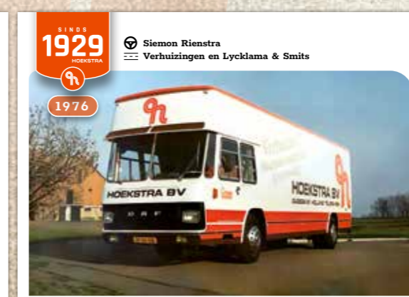
SINDS 1929 HOEKSTRA Simon Rienstra Verhuizingen en Lycklama & Smits 1976