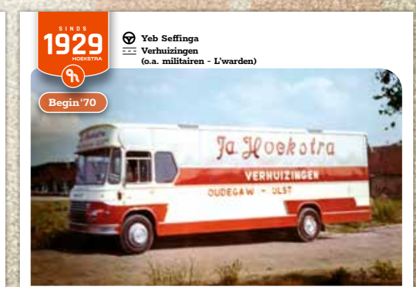
SINDS 1929 HOEKSTRA Yeb Seffinga Verhuizingen (o.a. militairen - L'warden) Begin '70

Ga Hoekstra Transpotify en luister naar de muziek die uit de autoradio klonk toen bovenstaande wagens op de weg reden