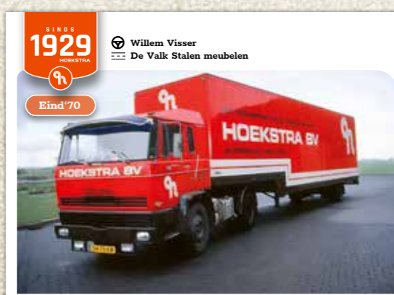
SINDS 1929 HOEKSTRA Willem Visser De Valk Stalen meubelen Eind '70