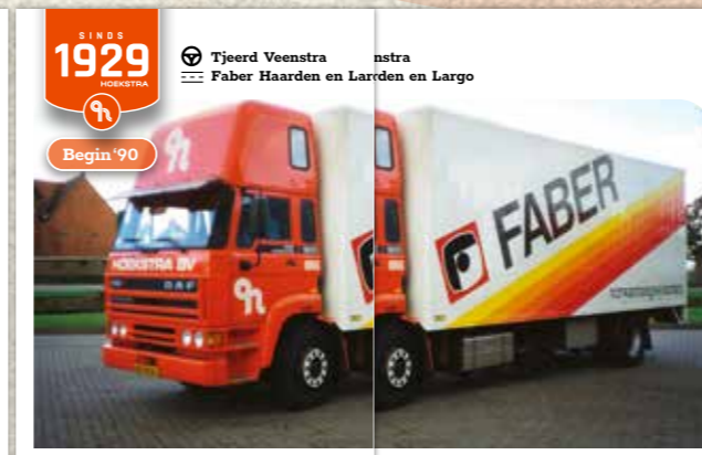
SINDS 1929 HOEKSTRA Tjeerd Veenstra Faber Haarden en Larden en Largo Begin '90