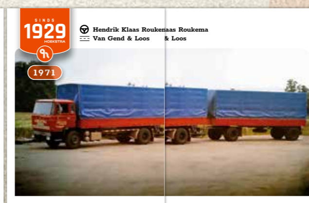
SINDS 1929 HOEKSTRA Hendrik Klaas Roukema Van Gend & Loos & Loos 1971