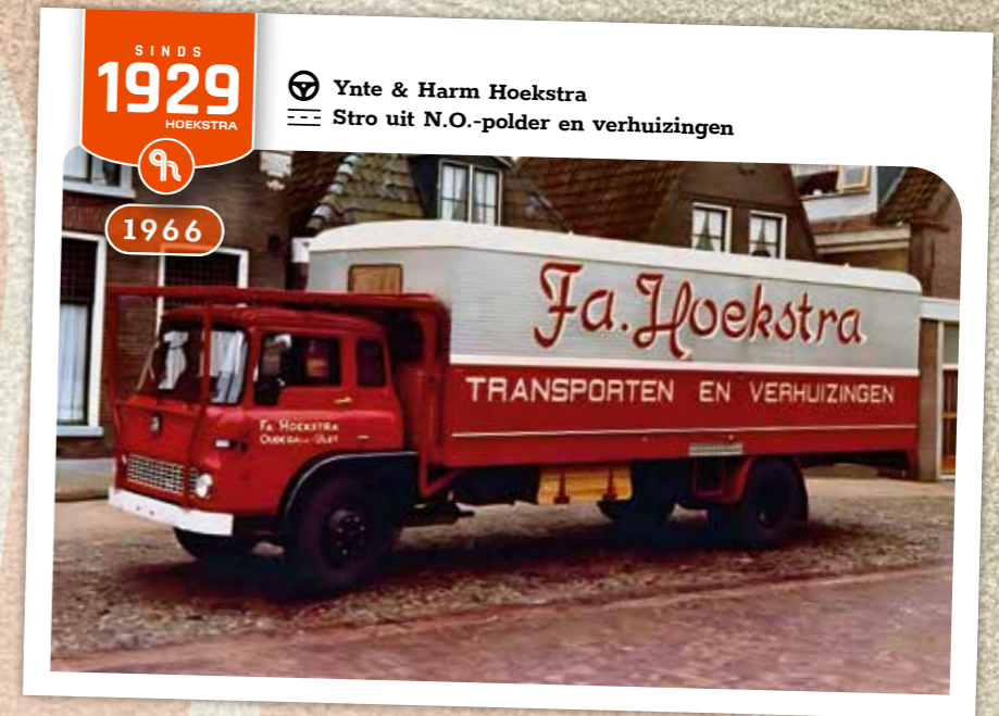
SINDS 1929 HOEKSTRA 1966

Met 95 jaar historie zijn er heel wat mooie beelden te maken met oude wagens uit de rijke Hoekstra-historie! Een greep uit ons wagenpark door de jaren heen, met chauffeurs en hun werkzaamheden. Weer in de stemming komen van die jaren? Op Hoekstra Transpotify luister je de muziek behorende bij de jaren waarin deze wagens rondreden op Neerlands wegen!